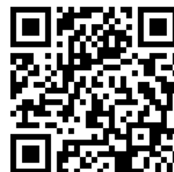
ヴァーチャル産業交流展2020 QRコード

オンライン QRコード又はURLよりアクセスしてください。 https://www.sangyo-koryuten.tokyo/