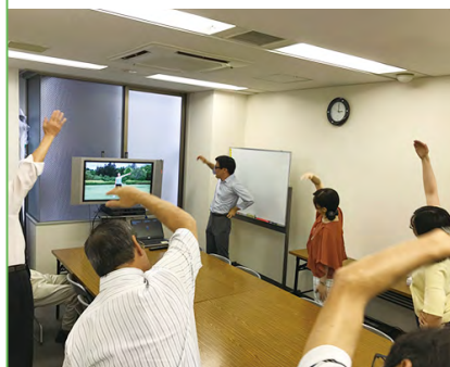
虎ノ門で働く健康部長のブログ