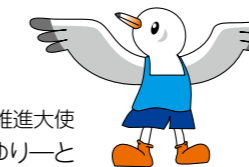
東京都スポーツ推進大使 ゆりーと